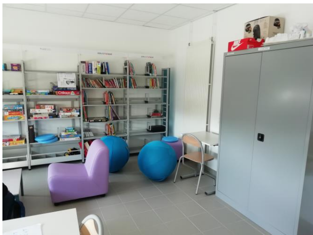
Coin lecture/Jeux éducatifs

Le dispositif ULIS, c'est aussi des moyens matériels plus importants : une salle plus grande, des espaces de travail différenciés (coin lecture, jeux éducatifs, mobilier neuf, matériel informatique), des outils pédagogiques adaptés.